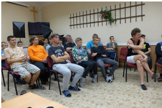
1. 9. - SETKÁNÍ VŠECH STUDENTŮ PŘIVÍTÁNÍ „PRVÁKŮ“