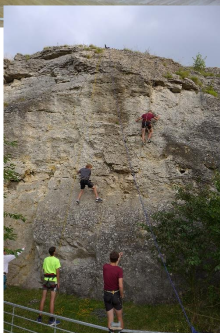
23. 9. - HOROLEZENÍ – STRÁNSKÁ SKÁLA